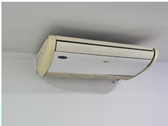
IMAGEM APARELHO DE AR CONDICIONADO TIPO SPLIT 30.000 BTUS:

SERVIÇO PÚBLICO FEDERAL CONSELHO FEDERAL DE FARMÁCIA CONSELHO REGIONAL DE FARMÁCIA DO ESTADO DE SERGIPE