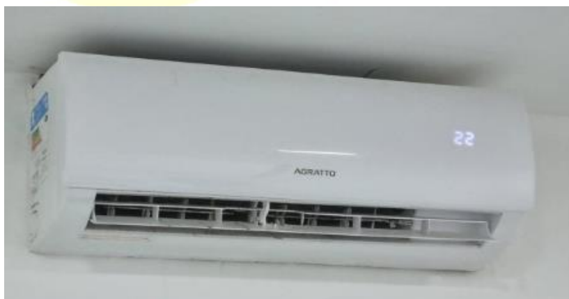
IMAGEM APARELHO DE AR CONDICIONADO TIPO SPLIT 9.000 BTUS: