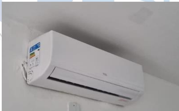
IMAGEM APARELHO DE AR CONDICIONADO TIPO SPLIT 12.000 BTUS: