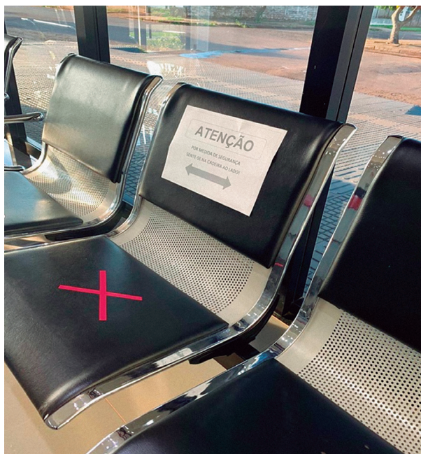
Figura 3 - Orientação em relação a ocupação das cadeiras em sala de espera.